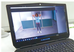
オンラインストレッチライブ配信

これまで専門のインストラクターが各職場を巡回し、デスクワーク中心の社員が自席で簡単にできる肩こり、腰痛予防ストレッチなどを実地指導する社内巡回ストレッチや、ヨガインストラクターによるヨガ教室を定期的で開催してきました。在宅勤務を原則とした勤務体制が定着する中、オンラインによる「自宅に居ながら取り組める健康経営施策」を行っています。今後もこのような様々な施策を積極的に推進し、社員の健康増進に努めていきます。